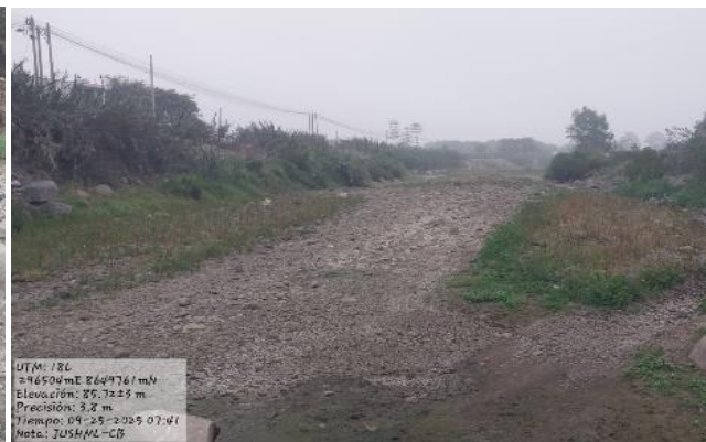
SECTOR PUENTE GUAYABO