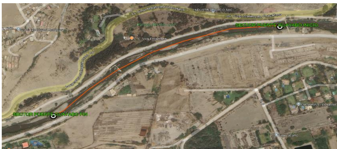
5.- IMAGEN SATELITAL DE ZONA VULNERABLE